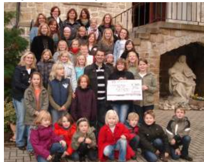
Stellvertretend für alle Kinder, die am Scholentag