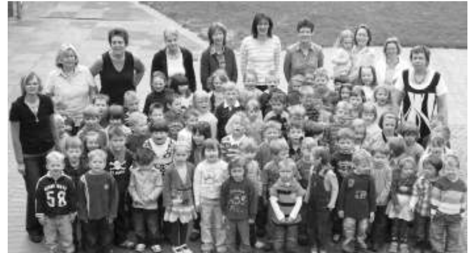
Kinder und Erzieher im Jubiläumsjahr 2009

an dem das Kind viele neue Erfahrungen sammeln kann. In einer Umgebung, in der es sich wohl - und angenommen fühlt, soll es zum Entdecken, Verstehen und Handeln aufgefordert werden.